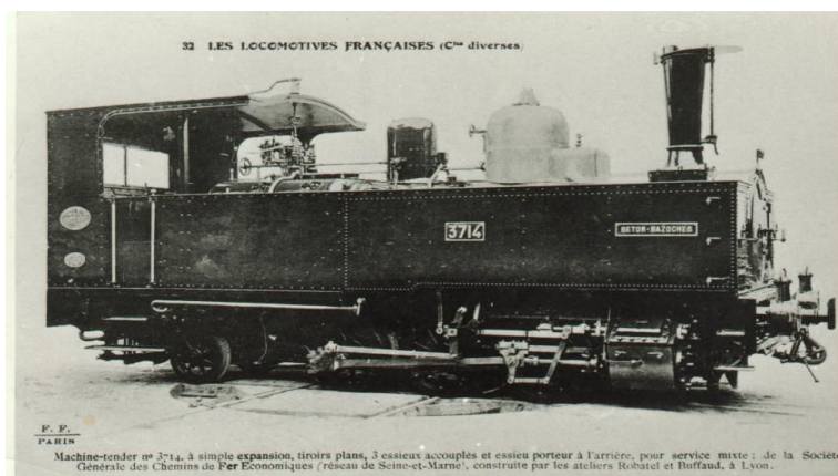
Machine-tender n° 3714, à simple expansion, tiroirs plans, 3 essieux accouplés et essieu porteur à l'arrière, pour service mixte : de la Société Générale des Chemins de Fer Economiques (réseau de Seine-et-Marne), construite par les ateliers Robard et Thiffault, à Lyon.