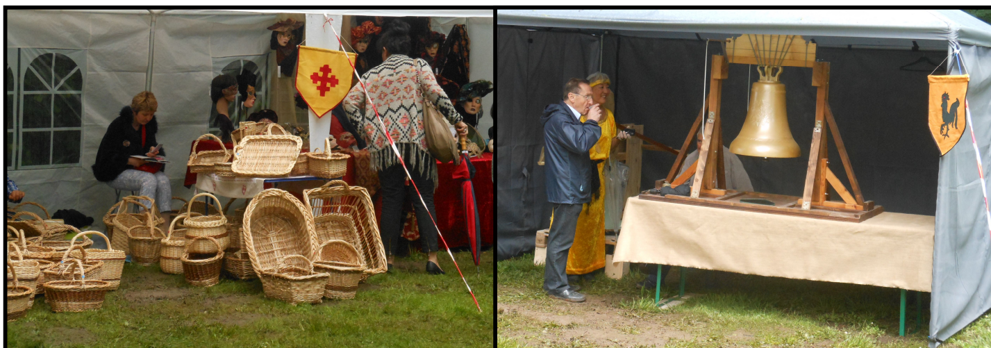
Fête Historique de Pays 19 juin 2016 domaine de Fortbois